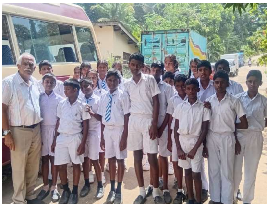
Schoolbus Rattota Sri Lanka (SRL2)

Een tweetal, door Een Aarde ondersteunde, stichtingen doen een kort verslag van hun werkzaamheden en ervaringen van bezoeken aan de projecten (Stichting Yaluva Sri Lanka en Stichting Nica Friends). Hierdoor krijgen de vrijwilligers een beter inzicht in wat er met de door hen gegenereerde opbrengsten gebeurt.