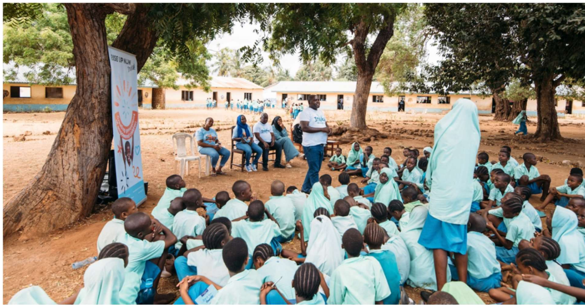
Rise Up Now: weerbaarheidslessen (Kenia KE11)