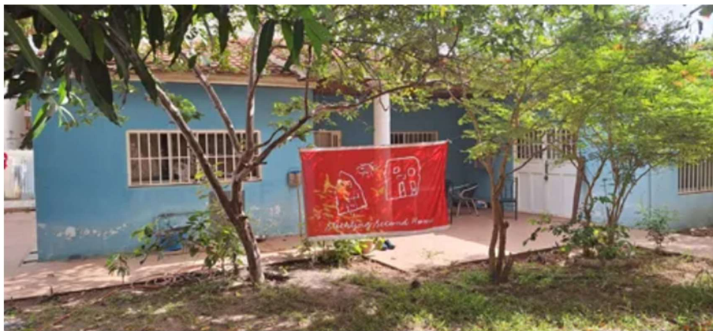
Eindelijk een eigen huis voor Second Home (Gambia GA10)

Totaal uitgekeerd aan projecten in 2024: 127.900 euro