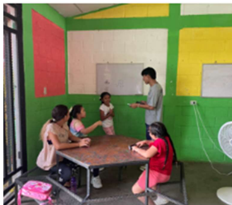
Learning Center van La Esperanza Nicaragua (NIC2)